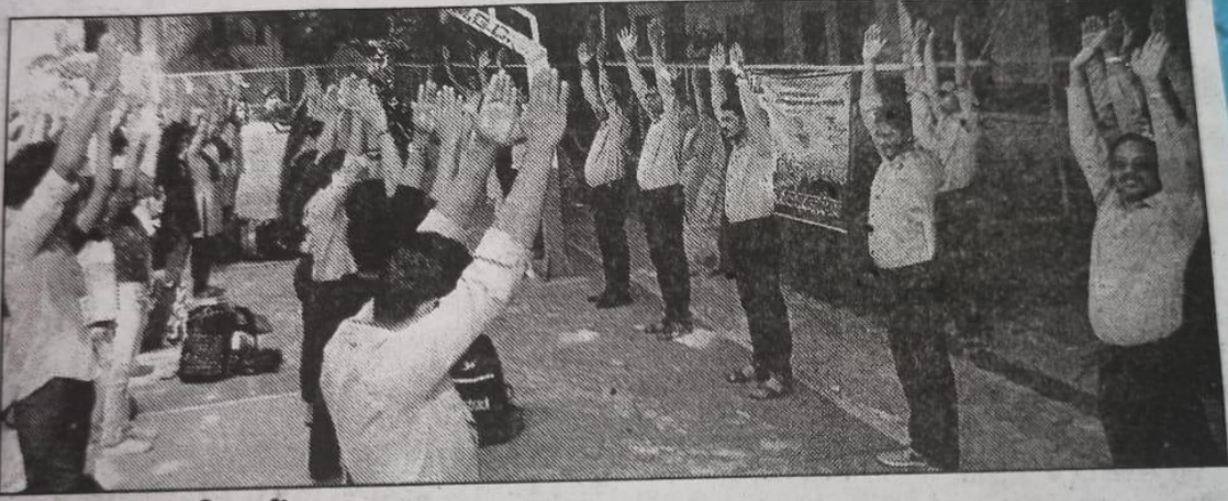
कवायत करताना विद्यार्थी व प्राध्यापक